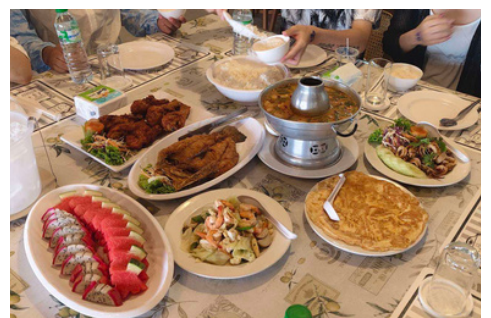
(อาหาร Package A และ B สำหรับ 1 ท่าน)